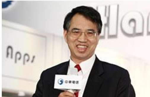
中華電信董事長呂學錦